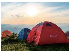
テントやタープの 使用後のお手入れ