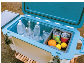
クーラーボックス 内部のお手入れ