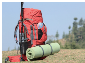
リュックなどの 洗にくいもの